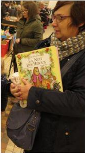
Contes de la ferme avec l'album « La