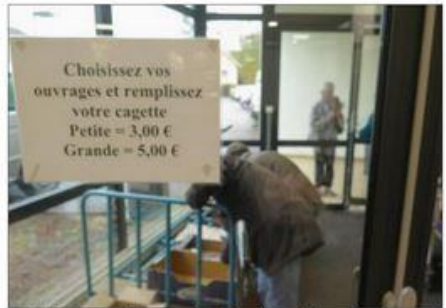
La SHAARL a sorti des centaines de milliers de bouquins de ses réserves avec une politique de prix agressive.