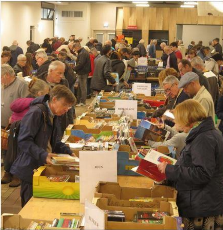
La foule à l'Espace du Sapeur pour la foire aux livres de la SHAARL qui a sorti 65 m 3 de livres de ses réserves.