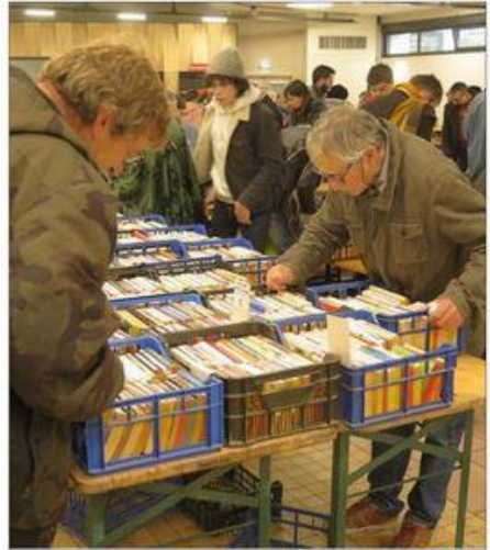
La 29 e édition n'a pas échappé aux plus férus des lecteurs de l'arrondissement de Lure.