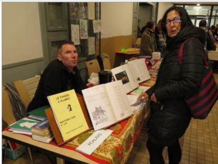
La 29 e édition de Bouquimania, c'est aussi l'occasion de parler poésie avec l'association Acalavo et sa revue « Le panier à plumes ».