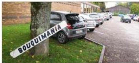
C'est le grand rendez-vous de l'espace du Sapeur.

Jusqu'à lundi à Lure. À l'Espace du Sapeur samedi et dimanche de 9 à 18 h et lundi jusqu'à 17 h. Entrée libre.