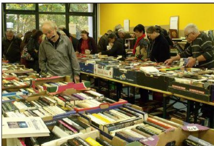
■ Dès l'ouverture, environ 350 personnes ont pris d'assaut l'espace du Sapeur.

Un travail de titan pour ce passionné d'histoire qui, naturellement ne met pas en vente ceux qui alimentent la